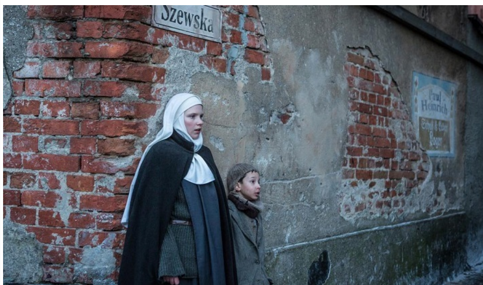
Immagine da: Les innocentes di Anne Fontaine.

Il cinema è ormai divenuto non solo un'occasione preziosa di aggregazione e approfondimento culturale nella vita delle parrocchie, delle associazioni religiose e negli enti didattici di ispirazione cristiana, ma è utilizzato come strumento di introduzione per il cammino liturgico, la preparazione a eventi pastorali, la meditazione individuale e collettiva finalizzata a gesti sacramentali. Prendiamo qui in considerazione alcune pubblicazioni sul tema.